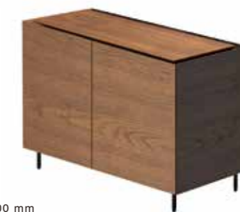
Cabinet W700 D350 H700 mm