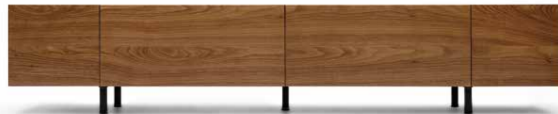
TV board W2,000 D450 H395 mm