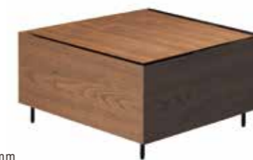
Center Table W700 D700 H400 mm